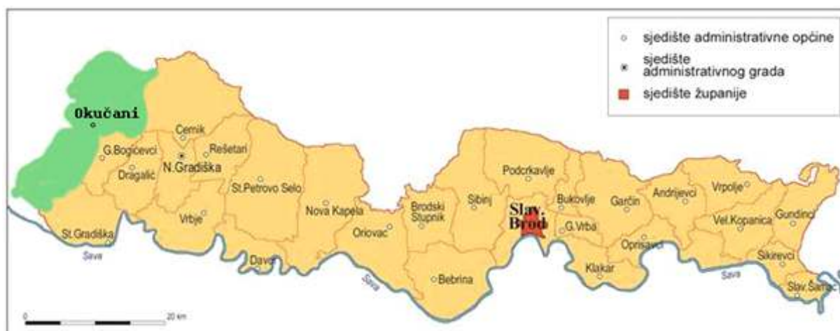
Slika 1: Položaj općine u Brodsko-posavskoj županiji

Područje općine prostire se na 159,31 km 2 i obuhvaća 17 naselja: Benkovac, Bijela Stijena, Bobare, Bodegraj, Cage, Čaprginci, Čovac, Donji Rogolji, Gornji Rogolji, Lađevac, Lještani, Mašićka Šagovina, Okučani, Širinci, Trnakovac, Vrbovljani i Žumberkovac. U odnosu na prostor Županije sa površinom od 2.027 km 2 , područje općine čini 7,85% površine Županije.