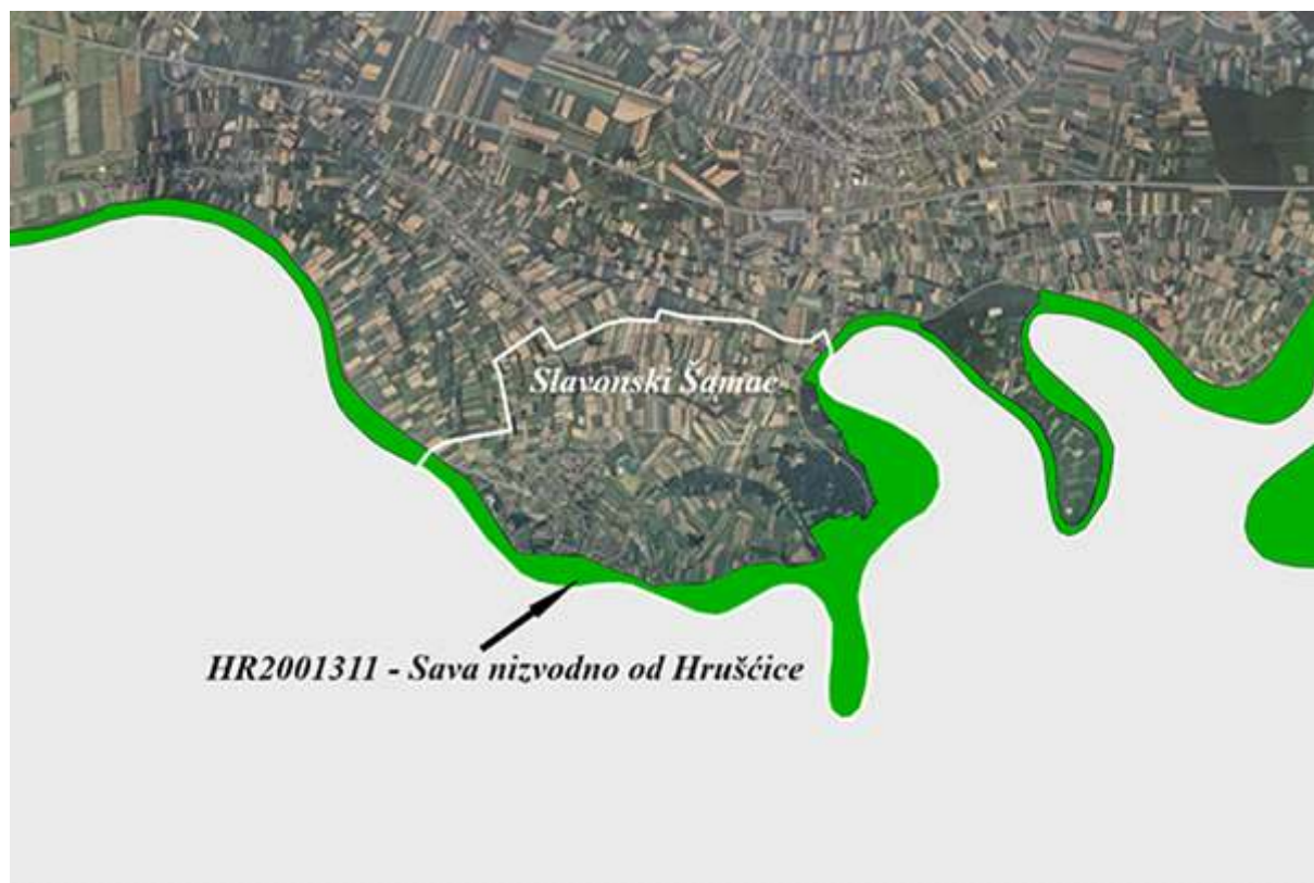
Slika 1: Sava nizvodno od Hrušćice (HR2001311), područje ekološke mreže značajno za vrste i stanišne tipove (POVS)